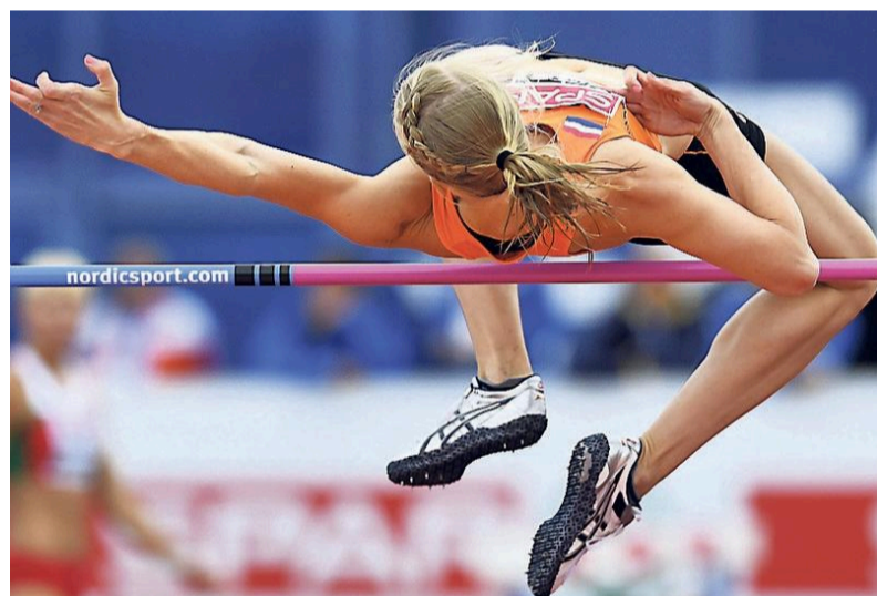
Alleen het hoogspringen was iets minder dan normaal.