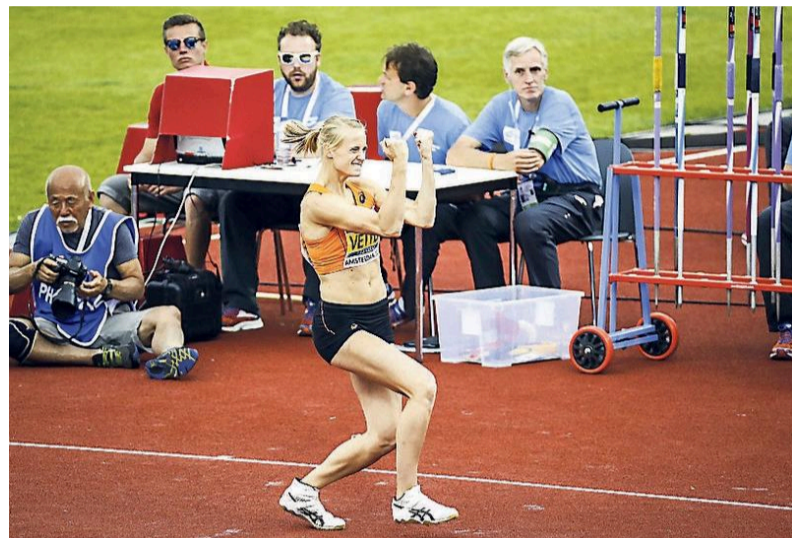
Een persoonlijk record bij speerwerpen van 55,76m.

In 2014 leek haar lichaam beter belastbaar. Ze maakte de meerkamp voor het eerst met een goed puntenaantal af. Toch bleef ze nog altijd in de schaduw van atleten als Dafne Schippers of Nadine Broersen staan. Maar in de maanden voor het EK overtuigde ze zichzelf dat ze daaruit moest stappen. Ook zij kon op internationale toernooien om de medailles strijden. „Je moet niet twijfelen aan jezelf want dan vergroot je de kans dat het niet gaat lukken.”