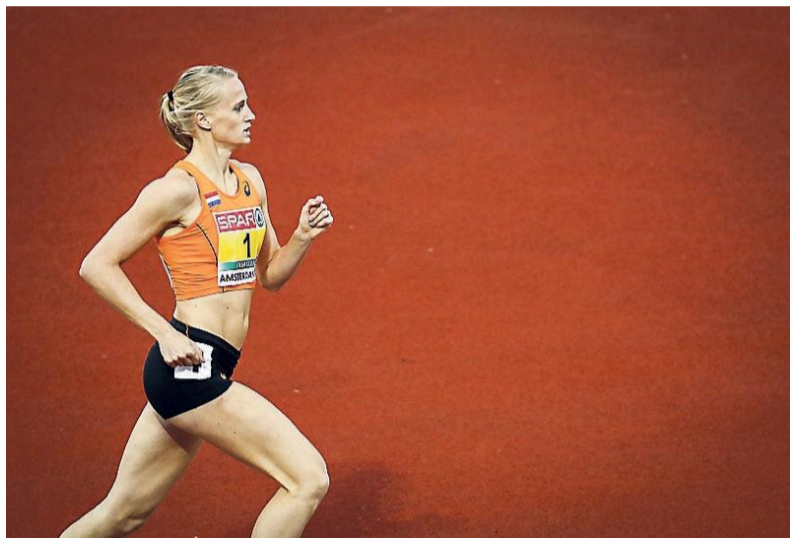
De laatste 100 meter van het toernooi.