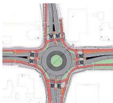
De nieuwe rotonde.