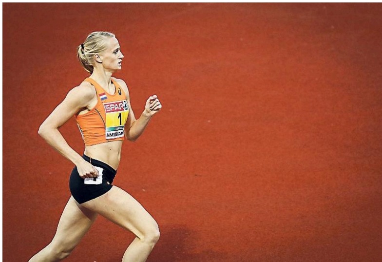
De laatste 100 meter van het toernooi.