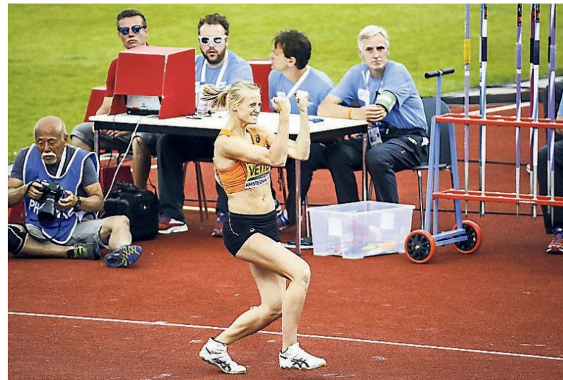
Een persoonlijk record bij speerwerpen van 55.76m.

In 2014 leek haar lichaam beter belastbaar. Ze maakte de meerkamp voor het eerst met een goed puntenaantal af. Toch bleef ze nog altijd in de schaduw van atleten als Dafne Schippers of Nadine Broersen staan. Maar in de maanden voor het EK overtuigde ze zichzelf dat ze daaruit moest stappen. Ook zij kon op internationale toernooien om de medailles strijden. „Je moet niet twijfelen aan jezelf want dan vergroot je de kans dat het niet gaat lukken.”